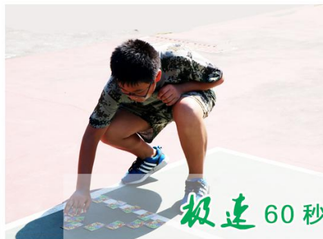
极速 60 秒